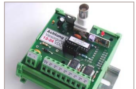
EFB-232-485-UM72 24V DC