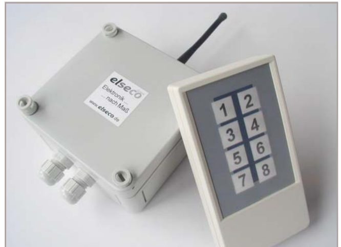
Funkfernsteuer-Empfänger EFB-232-485-PS94 und Funk-Handsender EFS-HS8K